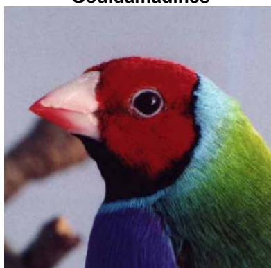
Voorheen 9 nu 8