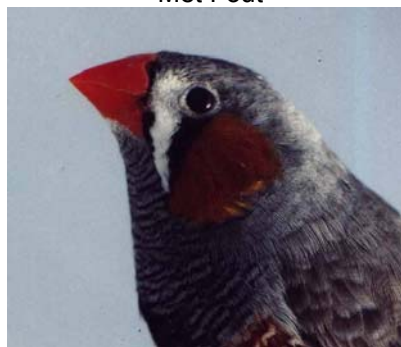
Voorheen 8 nu 7