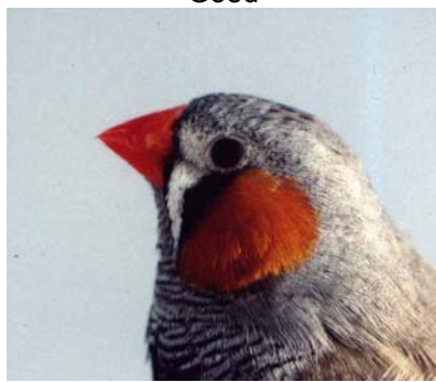
Voorheen 9 nu 8