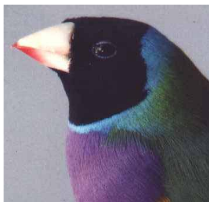
Voorheen 8 nu 7