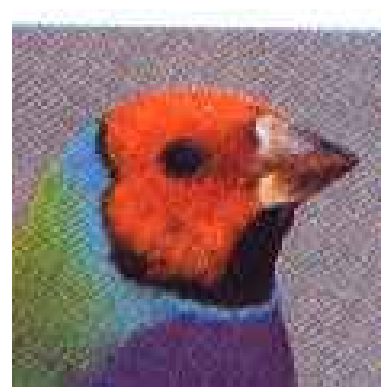
Voorheen 9 blijft 9