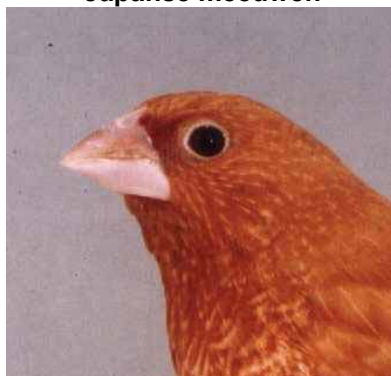
Voorheen 9 nu 8