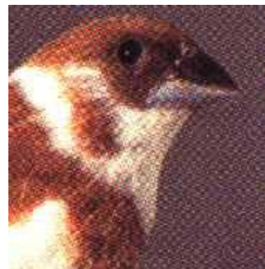
Voorheen 9 blijft 9

De opmerkingen zoals aangegeven bij de zebravinken gelden ook voor de Japanse meeuwen. Bij de schaal voor de gekuifde Japanse meeuwen dient echter een extra aanpassing gemaakt te worden. In de standaard blijkt dat schaal 4, de schaal voor gekuifde Japanse meeuwen, geen mogelijkheid biedt om een vogel op te waarderen naar 93 punten in de rubriek kuif. Tot op heden werd een Japanse meeuw met een prima kuif gewaardeerd met 24 punten. Met het geven van 24 punten kwam dan de Japanse meeuw (28-24-4-36) op 92 punten. Opwaarderen, zoals bij zebravinken mogelijk is in de rubriek kuif, was dus niet meer mogelijk. Om deze reden is de puntenverdeling in schaal 4 aangepast overeenkomstig de zebravinken.