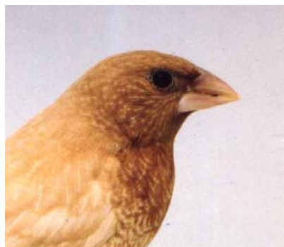
Voorheen 8 nu 7