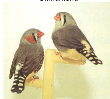
Voorheen 9 blijft 9

Zoals u ziet wordt in de schalen 1, 2 en 3 een goede kop/snavel vanaf nu beoordeeld met 8 punten. ( De punt die in deze rubriek nu minder wordt gegeven wordt door het geven van 5 punten in de rubriek poten weer toegevoegd.)